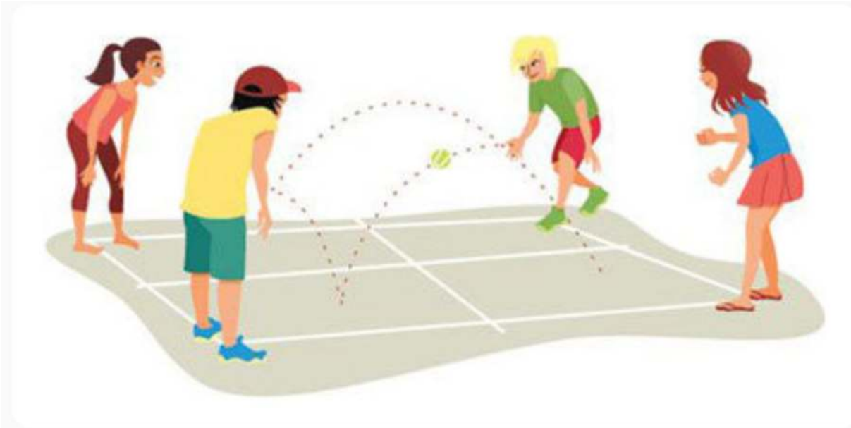
Playing Four Squares

Εκπληκτικά απλό και εθιστικό παιχνίδι που παίζεται όχι μόνο στην ώρα της Φ.Α. αλλά και στα διαλείμματα σε 1 αλλά και περισσότερα γήπεδα μέσα στην αυλή μια που πίνουν ελάχιστο χώρο.